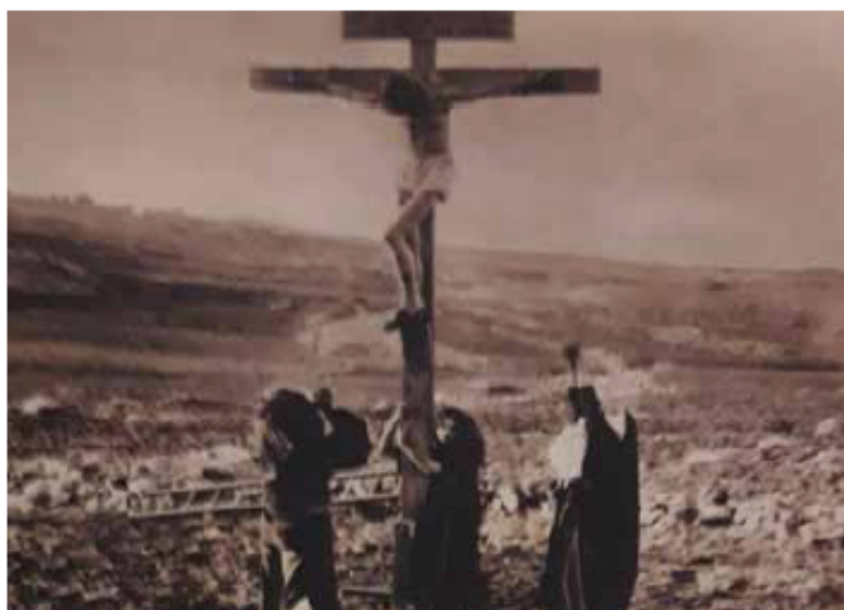
Stumfilmen "The life and passion of Christ" från 1900-talets början är en klassiker.

Till en början gjorde jag mig bekant med innehållet i boken The Music of the Silent Movies (Wise Publications, 2015). Här finns mycket repertoar och intressant information att ta till sig. På nätet (särskilt www.imslp.org ) fanns det också användbart notmaterial att ladda ner gratis.